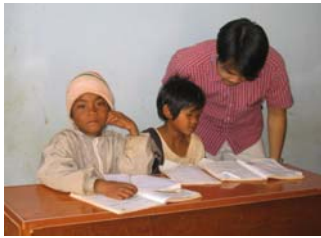
Chánh Tâm và hai em của dự án Pleiku.