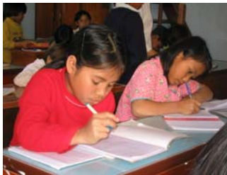
Các em trong dự án Lâm Đồng, Bảo Lộc.