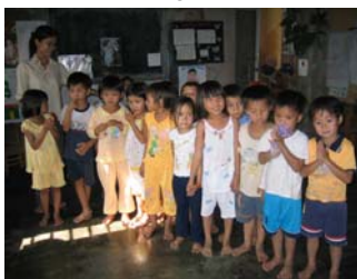
Dự án Huế và các vùng lân cận.