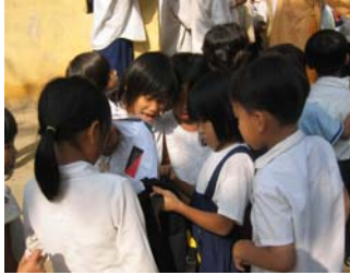
Các em nhận trang bị học tập ở Ô Môn Cờ Đỏ.