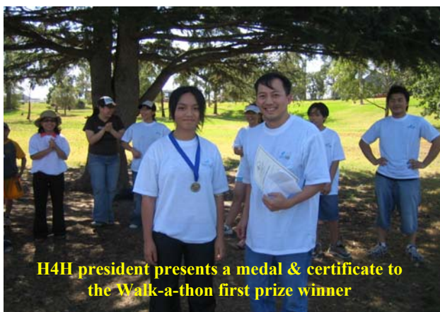
H4H president presents a medal & certificate to the Walk-a-thon first prize winner