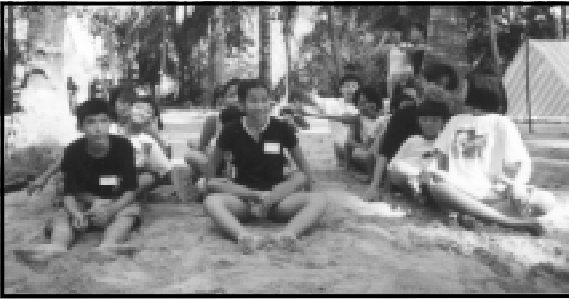
Trại hè Palawan, tháng 1 năm 2001 Summer camp at Palawan, January 2001