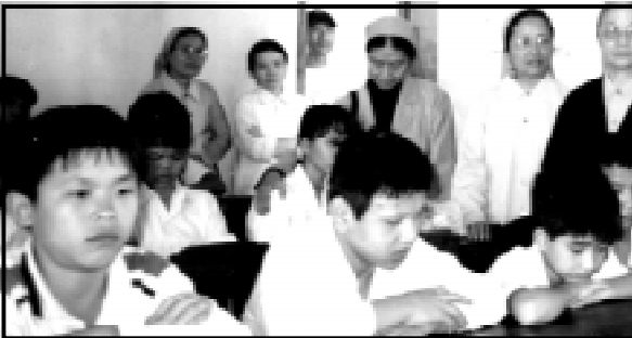
Các em học khiếm thị tại Quảng Trị, 12 - 2000 Blind students of Quang Tri province, Dec 2000

Con mắt ta có thể nhìn thấy nhiều màu khác nhau. Bạn hãy thử lấy hai bàn tay che kín mắt và không để một tia ánh sáng nào lọt qua kẽ tay. Bạn thấy gì ngoài một màu đen thăm thẳm? Đây chính là thế giới của người mù và cũng là thế giới