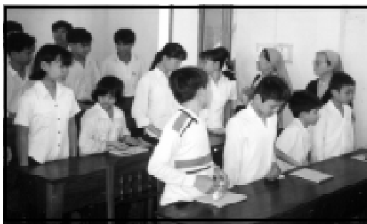
Các em học kiểm thị tại Quảng Trị, 12 - 2000 Blind students of Quang Tri province, Dec 2000

Our eyes enable us to see the beauty of colours. Let us explore by covering our eyes with both hands so that no light can penetrate through the cracks of our fingers. What do you see, our friends, apart from total darkness? Welcome to the world of the blind. This world of darkness belongs to many sightless children of Quang Tri Province, Central Vietnam, for whom we initiated a sponsorship program.