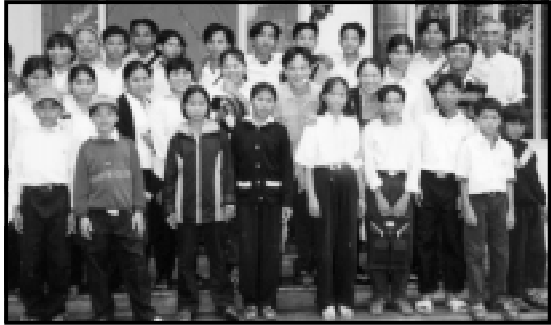
H4H và các em trong CT bảo trợ học sinh nghèo, VN 2.2001 H4H and all students in the Education Project, VN Feb 2001