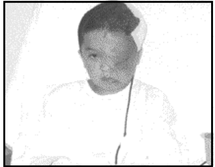
Và sau khi giải phẫu, 10 - 2000 And after the operation, Oct 2000